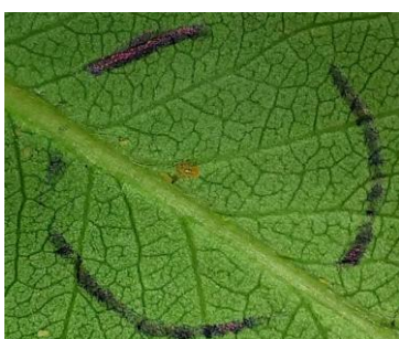
Fig. 1: Ninfas N1-N3 e Ovos

http://www.dgv.min-agricultura.pt/portal/page/portal/DGV