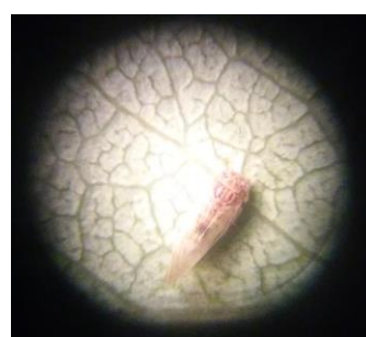
Fig. 3: Adulto