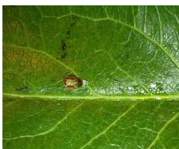
Fig. 2: Ninfa N5