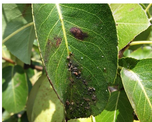
Fig. 4: Melada e necroses nas folhas